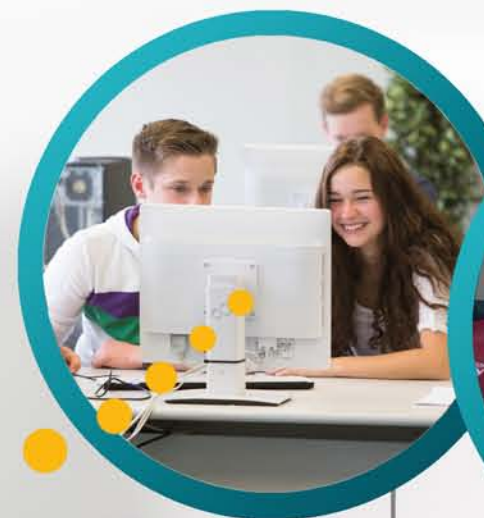
BFS Wirtschaft/ Büromanagement