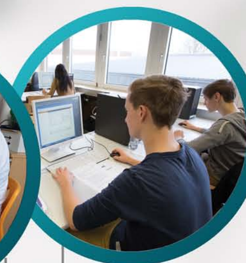
BFS Wirtschaft/ Einzelhandel