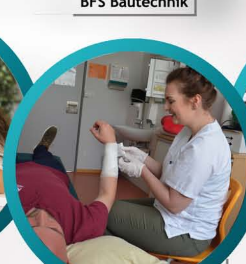
BFS Hauswirtschaft Pflege